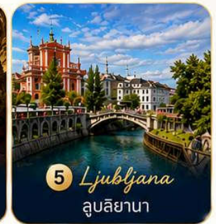
5 Ljubljana ลูบลียานา