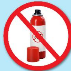
ขวดน้ำยา ซ่าแมลง