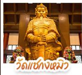
วัดเชกงไฉมว