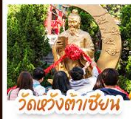
วัดเซ่งต้าซิงหน