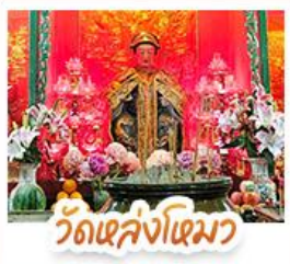
วัดเส่งไฉมว

นั่งรถรางพีคแตรมสู่ TOP OF PEAK • ช้อปปิ้งจตุจักรก๊ก และ CITYGATE OUTLAETS • นั่งกระเช้าองปิง สักการะพระใหญ่เทียนถาน • จอพรเจ้าแม่หล่งโหมว แมองง 5 มังกร ให้ประสบความสำเร็จในทุกๆ ด้าน