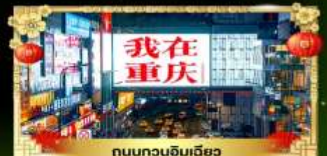
ถนนทวงจิมเฉียว