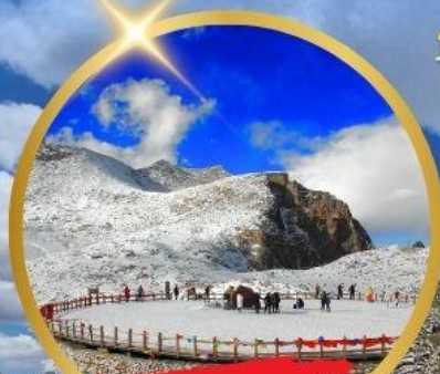
OPTIONAL TOUR ชารน้ำแข็งต้ากู่ปิงชวณ