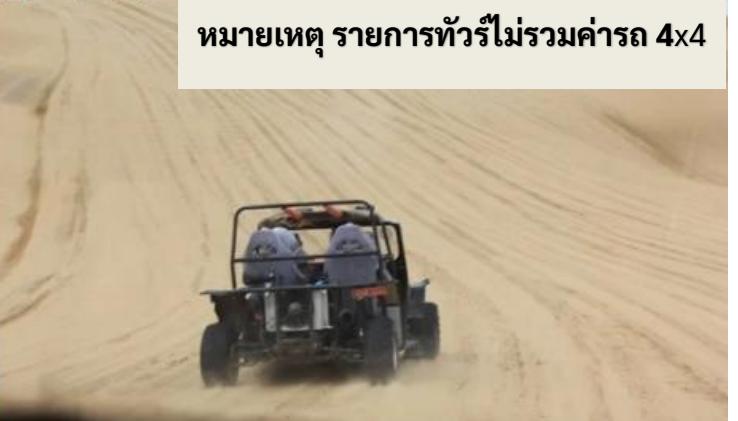
หมายเหตุ รายการทัวร์ไม่รวมค่ารถ 4x4

กลางวัน รับประทานอาหารกลางวัน ณ ภัตตาคาร (เมื่อที่ 8)