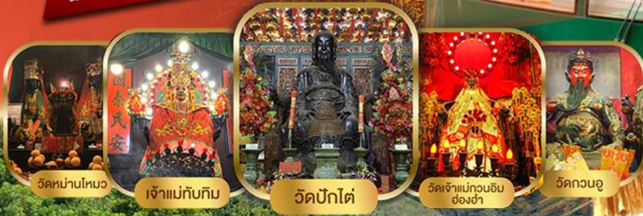
วัดบ้านโหวง

ไหว้พระเสริมดวงแบบจัดเต็ม รวมขึ้นพีคแกรม