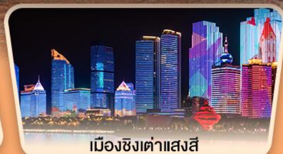
เมืองซิงต้าแสงสี