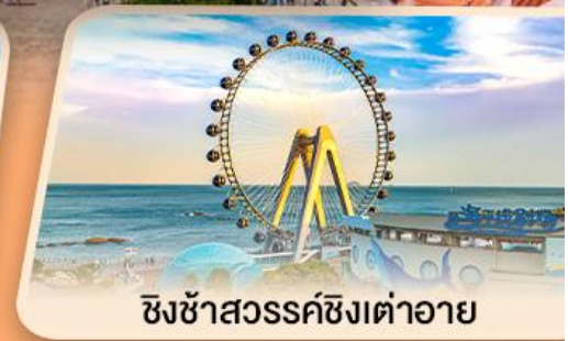
ชิงช้าสวรรค์ซิงต้าอายุ