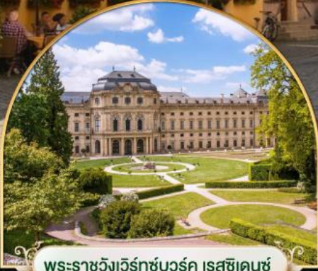
พระราชวังแวร์ซายส์ นคร ปารีส