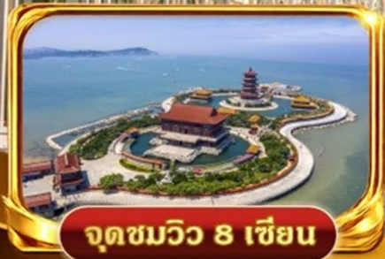
จุดชมวิว 8 เชียง