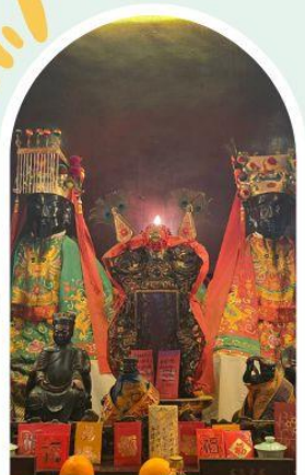
วัดหมิ่นโหมว