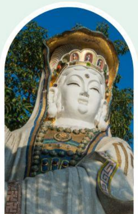
เจ้าแม่กวนอิม ธิพลสัย