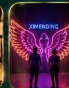
จุดเช็คอินสุดฮิต