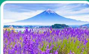
สวนโออิชิปาร์ก