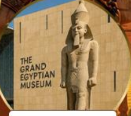
พีพีรภัณฑ์แกรนด์อียิปต์