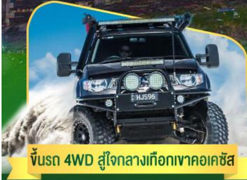
คันรถ 4WD สู้อีกกลางเทือกเขาคอเคซัส