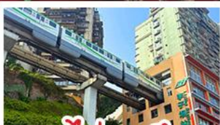
รถไฟทะลุคัง