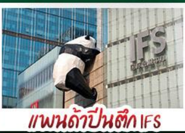
แพนด้าป็นตัก IFS

พระพุทธรูปเล่อซาน - จินฝอซาน - รถไฟฟ้าทะเลสุติก อุ้มหลง - แพนด้าป็นตัก IFS