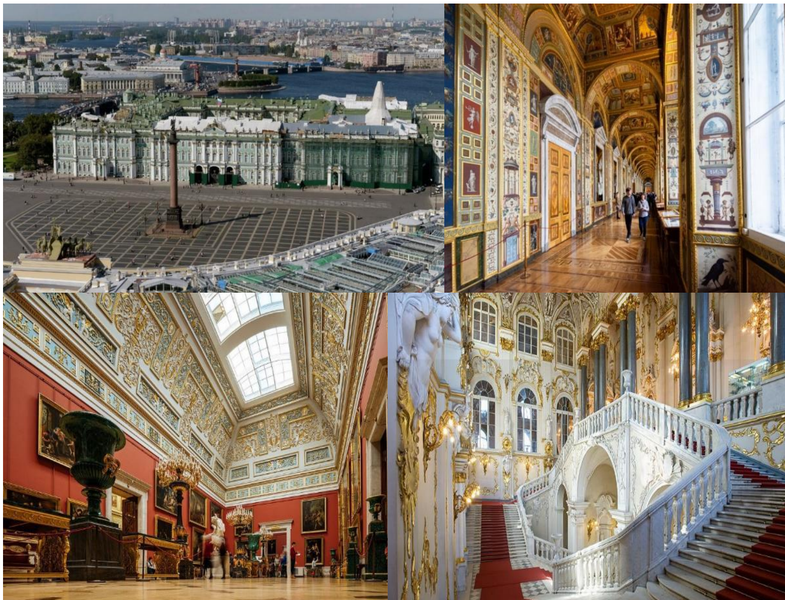
ค่ำ รับประทานอาหารค่ำ ณ ภัตตาคาร (อาหารจีน) นำท่านเข้าสู่ที่พัก Cosmos Saint-Petersburg Pribaltiyskaya Hotel หรือเทียบเท่า (คืนที่ 6)

นำท่านแวะถ่ายภาพ โบสถ์หยดเลือด (Church of the Savior on Spilled Blood) (ถ่ายภาพด้านนอก) เป็นอนุสรณ์ที่พระเจ้าอเล็กซานเดอร์ที่ 3 สร้างขึ้นเพื่อรำลึกถึงพระบิดาพระเจ้าอเล็กซานเดอร์ที่ 2 ผู้ปลดปล่อยชาวนา ซึ่งถูกลอบปลงพระชนบริเวณนี้ หลังจากนั้นนำท่านสู่ มหาวิหารคาซาน (Kazan Cathedral) (ถ่ายภาพด้านนอก) สร้างขึ้นเพื่ออุทิศให้กับพระแม่แห่งคาซาน โดยสถาปนิก Andrey Voronikhin สร้างแบบจำลองอาคารตามมหาวิหารเซนต์ปีเตอร์ในกรุงโรม ภายในมหาวิหารมีเสาจำนวนมากสะท้อนถึงเสาหินเรียงแถวภายนอก ภายในมีประติมากรรมและไอคอนมากมายที่สร้างสรรค์โดยศิลปินชาวรัสเซียชั้นนำ