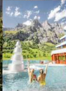
แช่สปปาลอยเทอรันา