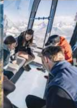
Matterhorn Glacier Paradise