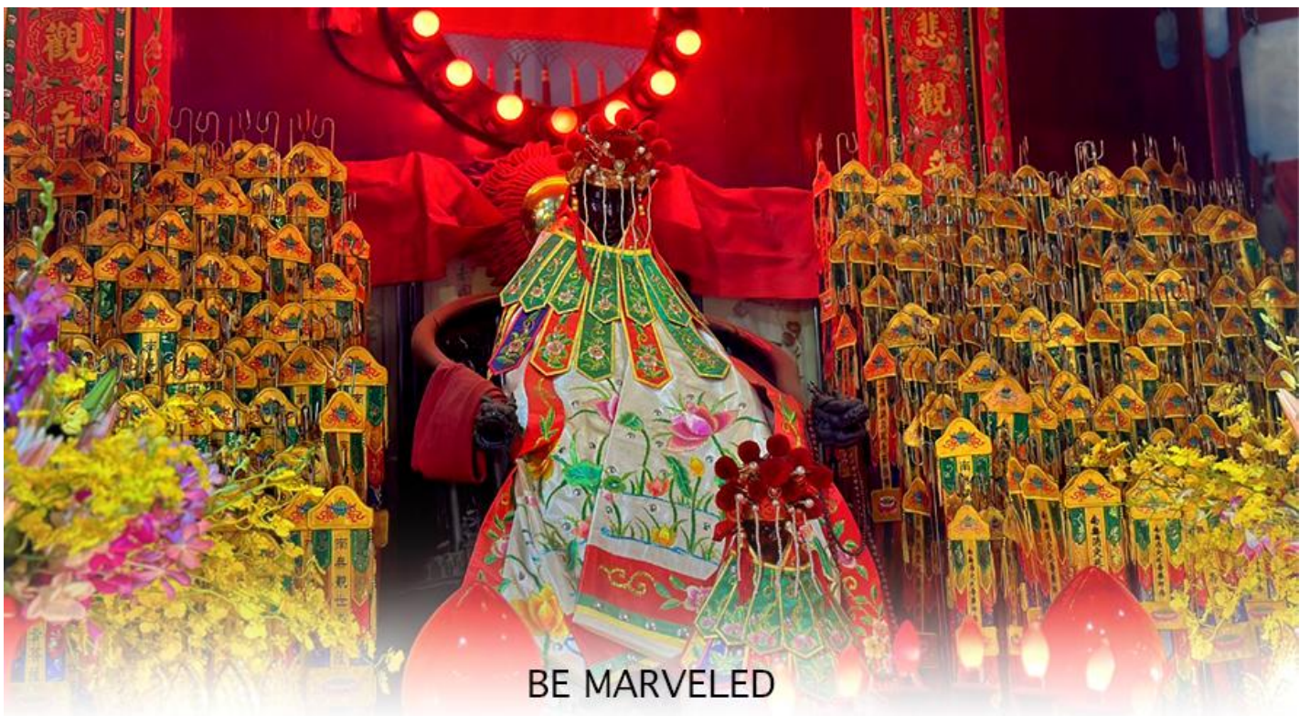
BE MARVELED วัดเจ้าแม่กวนอิมฮองอำ (ยิมนิน)

ให้เดินทางกลับไปกราบไหว้ และขอบคุณเจ้าแม่กวนอิมอีกครั้ง โดยเตรียมชุดไหว้และกระดาษเงินกระดาษทอง ที่เป็นเหมือนเงินที่เรานำมาคืน เป็นการไหว้เพื่อคืนเงินเจ้าแม่กวนอิมนั่นเอง