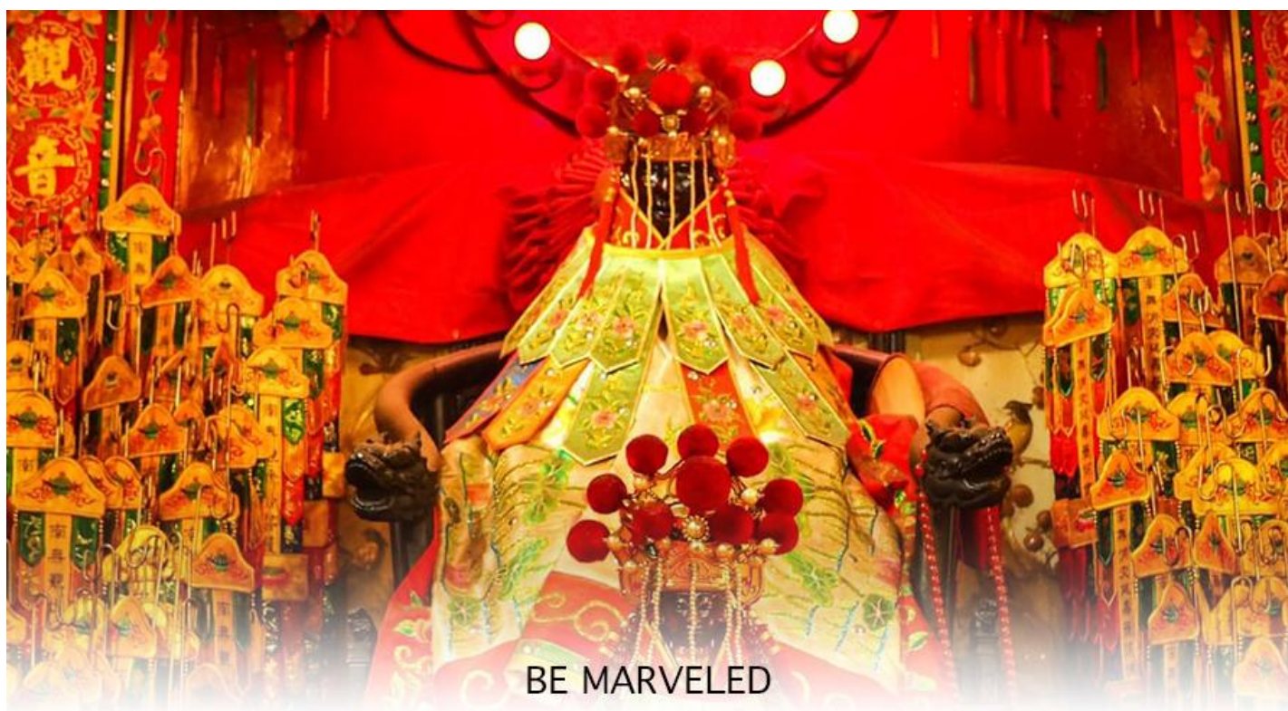
BE MARVELED วัดเจ้าแม่กวนอิมฮ่องฮ่า (ยิมจิน)

ถูกสร้างขึ้นในปี ค.ศ. 1873 ด้วยสถาปัตยกรรมแบบวัดจีนดั้งเดิม ในทุกๆ ปี จะมีนักท่องเที่ยวทุกเชื้อชาติจากทั่วโลกแวะเวียนมากราบไหว้ รวมถึงมาร่วมพิธีเยี่ยมเงิน เจ้าแม่กวนอิมฮ่องฮ่า หรือ วันเปิดทรัพย์ ซึ่ง 1 ปีจะมีฤกษ์ดีแค่ 1 วันเท่านั้น ปี 2569 เป็นวันที่ 14 มีนาคม 2569 นี้การทำพิธีเยี่ยมเงินเจ้าแม่กวนอิม วันเปิดพระคลัง หรือ วันเปิดทรัพย์ เป็นความเชื่อของคนเชื้อสายจีน ทั้งฝั่งฮ่องกง และมาเก๊าถือเป็นพิธีศักดิ์สิทธิ์ในการขอพรเจ้าแม่กวนอิม เชื่อกันว่าเป็นการไหว้และการทำพิธีที่ช่วยเสริมดวงให้เงินทองไหลมาเทมา การขอยืมเงินองค์กรกวนอิมที่ขึ้นชื่อเรื่องความเมตตา หรือทำการค้า เปิดธุรกิจค้าขายเจริญรุ่งเรือง