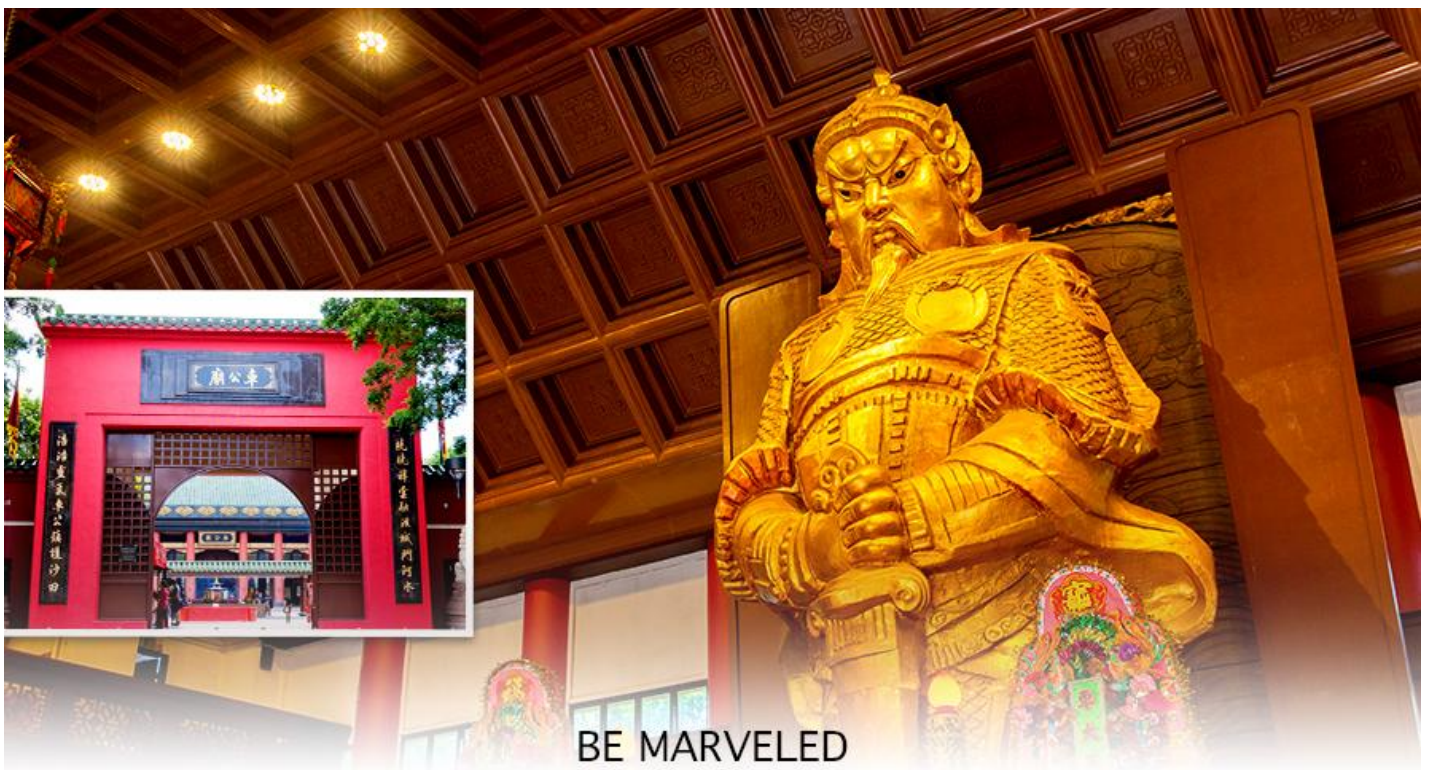
BE MARVELED วัดเขangkง

นำท่านเดินทางสู่ วัดเขangkงหมิว หรืออีกชื่อหนึ่งว่า “วัดกั๊งหันลม” หนึ่งในวัดดังของฮ่องกง ที่ประชาชนให้ความเลื่อมใสศรัทธามานาน ด้านในศาลจะมีรูปปั้นสูงใหญ่ของท่านเขangkง ซึ่งเป็นเทพประจำวัดแห่งนี้ เชื่อ ว่าองค์ท่านศักดิ์สิทธิ์ในการขอพรด้านโชคลาภ เสริมความเป็นสิริมงคล ปิดเป่าเรื่องร้ายๆออกไป และวัดแห่งนี้ยังเป็นสถานที่ที่นิยมสำหรับท่านที่ต้องการแก้ปีชงอีกด้วย โดยวิธีการไหว้ขอพรจากท่านเขangkงนั้น ท่านจะต้องเข้าไปยืนอยู่เบื้อง หน้ารูปปั้นของท่าน แล้วอธิษฐานขอพรพร้อมกับมองหน้าท่านอย่างมุ่งมั่นตั้งใจ จากนั้นให้ท่านทำพิธีหมุน “กั๊งหันแห่ง โชคชะตา” หรือ “กั๊งหันนำโชค” เพื่อหมุนรับแต่สิ่งดีๆ ให้เข้ามาในชีวิต