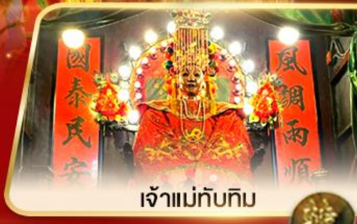
เจ้าแม่ทับทิม