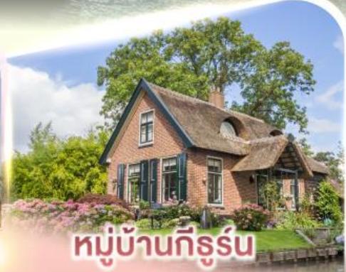
หมู่บ้านกีธูร์น